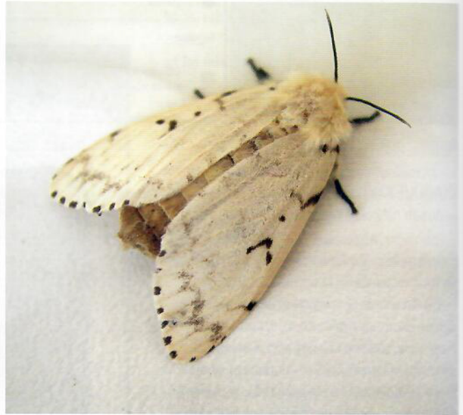
Obr. 2. Samička mnišky veľkohlavej.