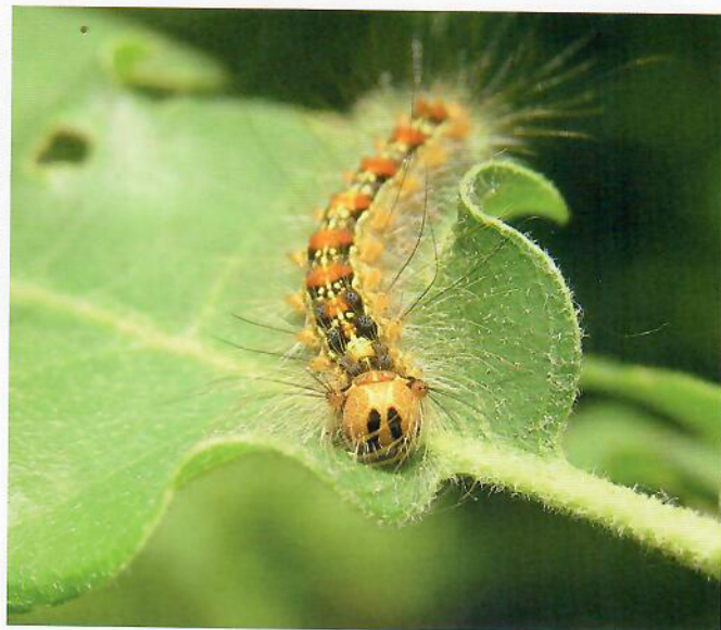
Obr. 3. Húsenice žijú na listnatých drevinách, najmä duboch.

Jediným účinným spôsobom ochrany porastov pred mníškou veľkohlavou je letecká aplikácia insekticídov. V minulosti bola odskúšaná aj metóda metenia samcov, pri ktorej sa tiež počíta s leteckou aplikáciou. LOS vydala usmernenie ako postupovať pri vybavovaní povolení a výbere prípravkov, ktoré je možné stiahnuť z internetovej stránky www.los.sk . LOS preferuje použitie biologických resp. iných, ekologicky akceptovateľných prípravkov. Vo všeobecnosti platí, že v 1. stupni ochrany prírody, podľa zákona 543