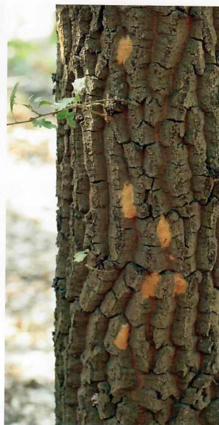
Obr. 4. Vajíčka prezimujú na kmeni stromu. V jednej znáške je 300–700 vajíčok.

Z doterajších výsledkov zistených monitoringom vyplýva, že v roku 2019 dôjde k silným žerom až k holožerom na cca 2 300 ha lesných