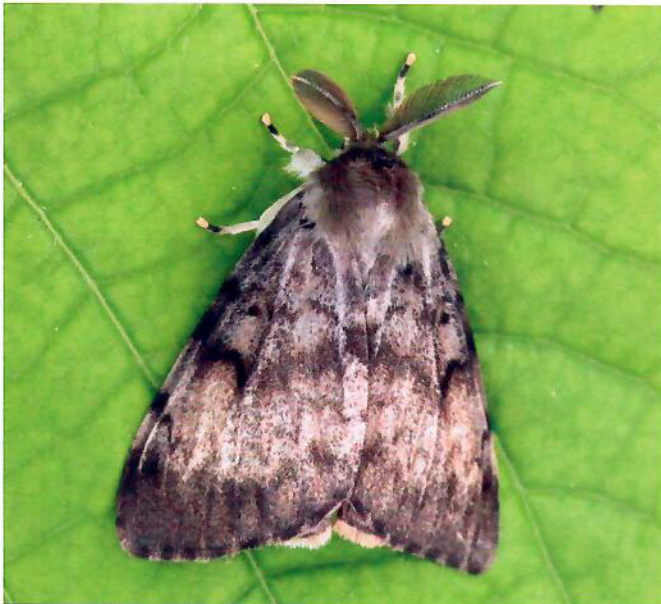
Obr. 1. Samček mnišky veľkohlavej.